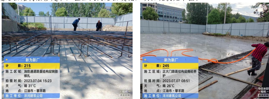
图 2.1-2 项目现状

2023年7月，建设单位委托我公司编制本项目的水土保持方案报告表，接到委托后，我公司立即组织技术人员前往项目所在地踏勘现场。现场踏勘情况如下：本项目已于2023年3月开始进行场地平整，预计2024年9月完工。目前正在进行消防通道路面结构层修建和厂区正大门路面硬化，项目现状见下图。